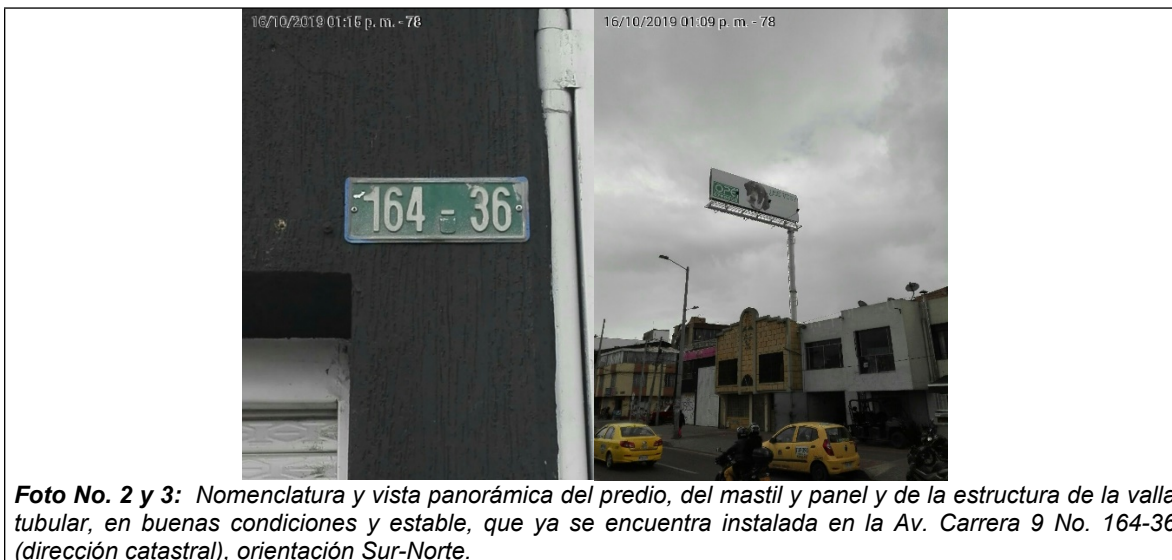
Foto No. 2 y 3: Nomenclatura y vista panorámica del predio, del mastil y panel y de la estructura de la valla tubular, en buenas condiciones y estable, que ya se encuentra instalada en la Av. Carrera 9 No. 164-36 (dirección catastral), orientación Sur-Norte.